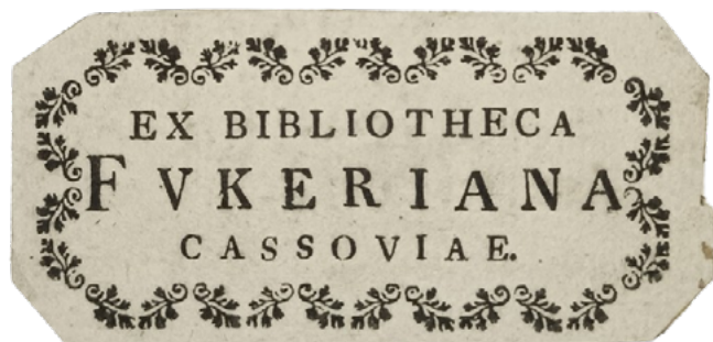
Obr. 8. Exlibris knižnice Fukerovcov