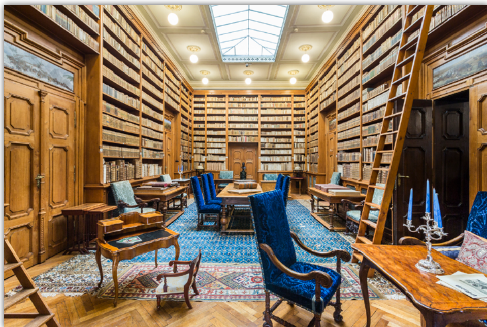
Obr. 1 Interiér knižnice Andrassyovcov v betliarskom kaštieli Téma exlibrisu a vlastníckych knižných značiek