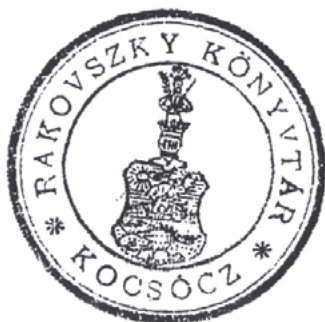
Obr. 4 a 5. Pečiatkový a heraldický exlibris knižnice rodiny Rakovských z Kočovského kaštieľa