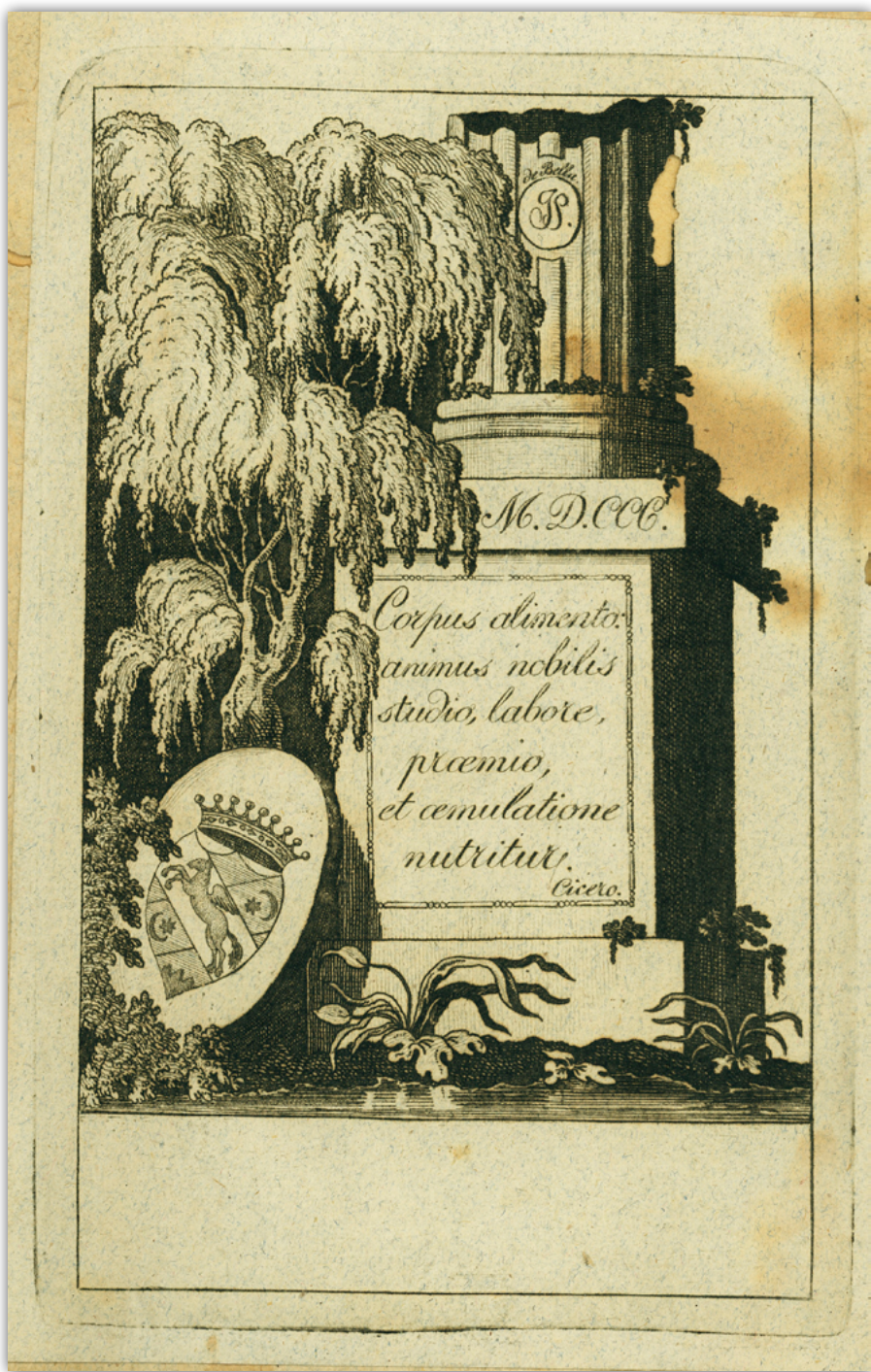
Obr. 3. Heraldický exlibris Jána Silvaya