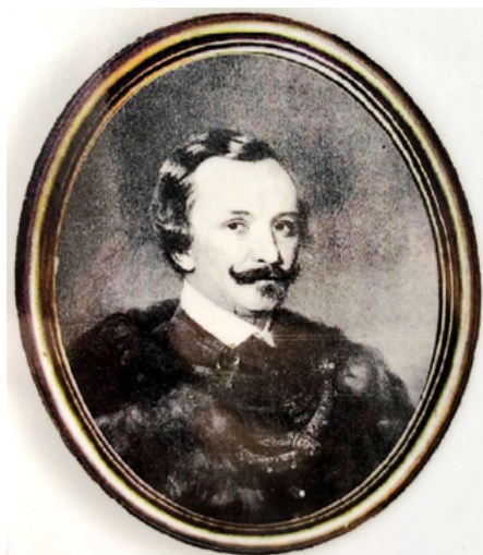
Obr. 2. Rudolf Chotek st. (1822 – 1903) 6