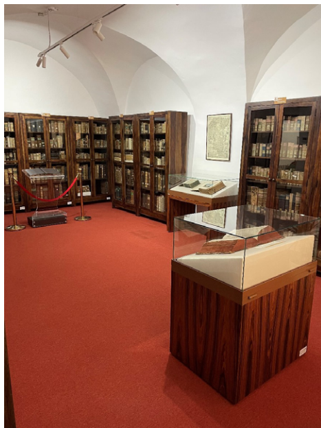
Obr. 4.-5. Priestory stálej expozície

Pre cieľovú skupinu deti a mládež ponúkame v rámci programu Vzácne knihy na dosah vhodným, primerane veku prispôsobeným spôsobom, odborný výklad a po dohode s učiteľmi aj praktické ukážky na vyučovacích hodinách. Naším cieľom je rozvíjať ich záujem o staré tlače a tým si vychovávať budúcich používateľov našej študovne. Historický fond prezentujeme aj v rámci Dní európskeho kultúrneho dedičstva , počas ktorých sa knižnica zapojila už niekoľkokrát, v spolupráci s Evanjelickým gymnáziom J. A. Komenského v Košiciach, Krajským pamiatkovým úradom Košice a ďalšími partnermi, do projektu Príbehy evanjelického cintorína v Košiciach . Študenti aktívne pracujú s historickými tlačami a získavajú informácie o významných osobnostiach pochovaných na uvedenom cintoríne, príp. o aktuálnej téme.