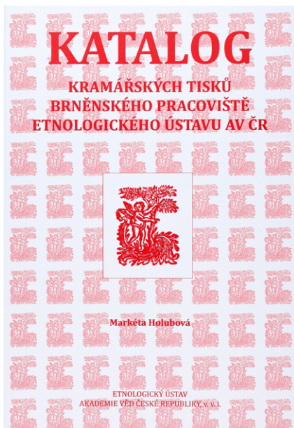
Obr. 2. Katalog kramářských tisků brněnského pracoviště Etnologického ústavu AV ČR