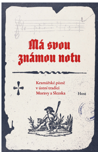
Obr. 3. Má svou známou notu. Kramářské písně v ústní tradici Moravy a Slezska